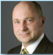
Rainer Bomba, Staatssekretär, Bundesministerium für Verkehr, Bau und Stadtentwicklung, Berlin